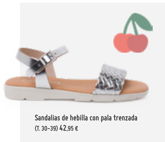
Sandalias de hebilla con pala trenzada (T. 30-39) 42,95 €