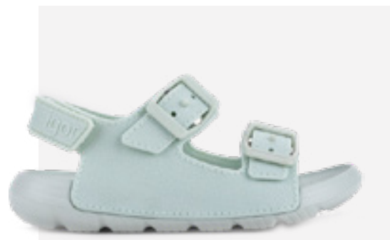
Sandálias de borracha sola EVA e dupla fivela (T. 23-34) 26,95 €