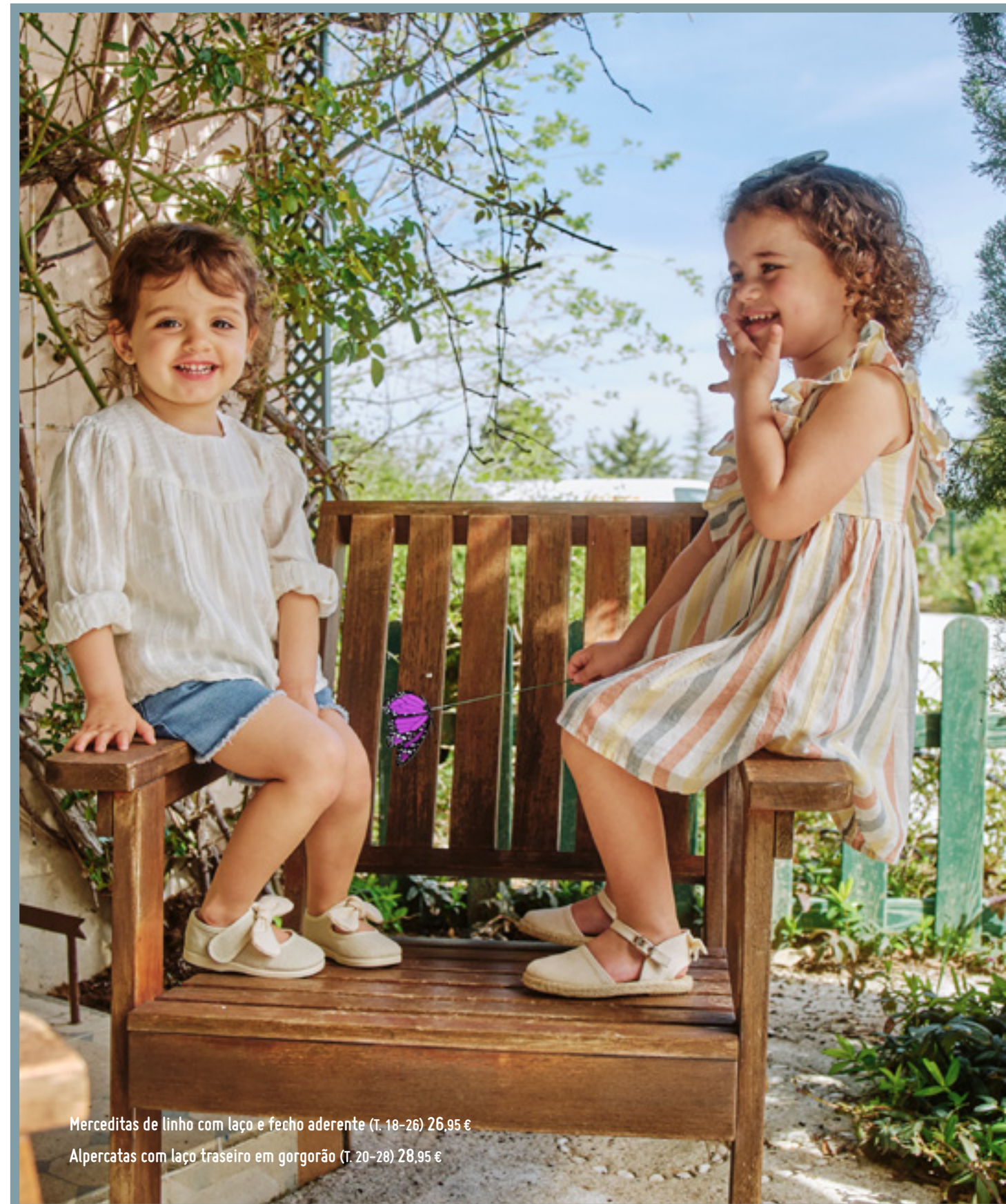
Merceditas de linho com laço e fecho aderente (T. 18-26) 26,95 €