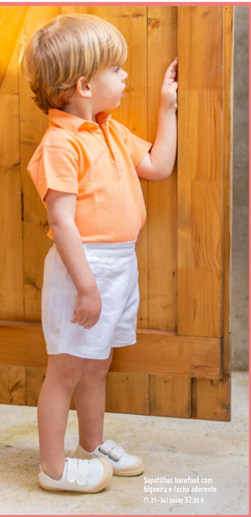
Sapatilhas barefoot com biqueira e fecho aderente (T. 21-34) desde 32,95 €