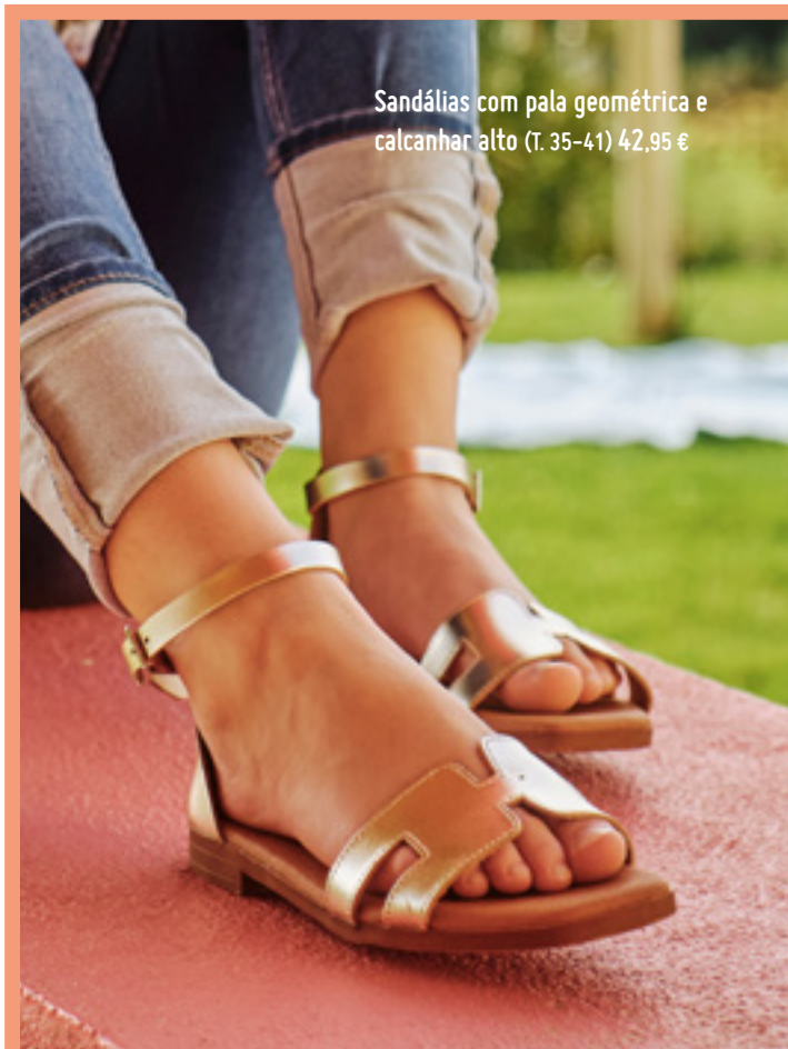
Sandálias com pala geométrica e calcanhar alto (T. 35-41) 42,95 €