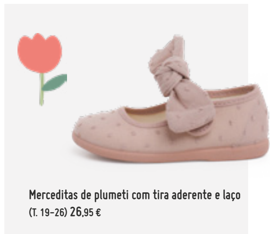
Merceditas de plumeti com tira aderente e laço (T. 19-26) 26,95 €