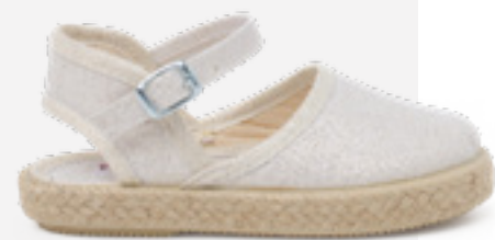
Alpercatas brilhantes com fivela (T. 20-30) 26,95 €