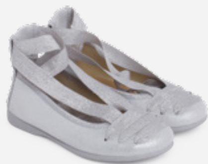
Sabrinhas brilhantes com fitas entrelaçadas (T. 26-39) desde 32,95 €