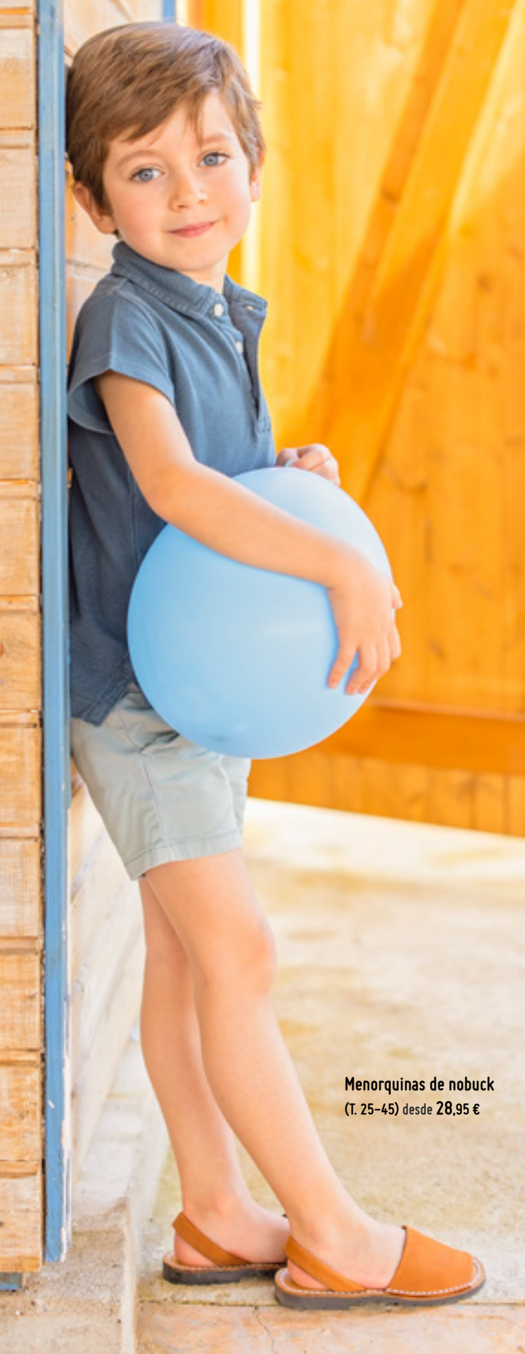
Menorquinas de nobuck (T. 25-45) desde 28,95 €