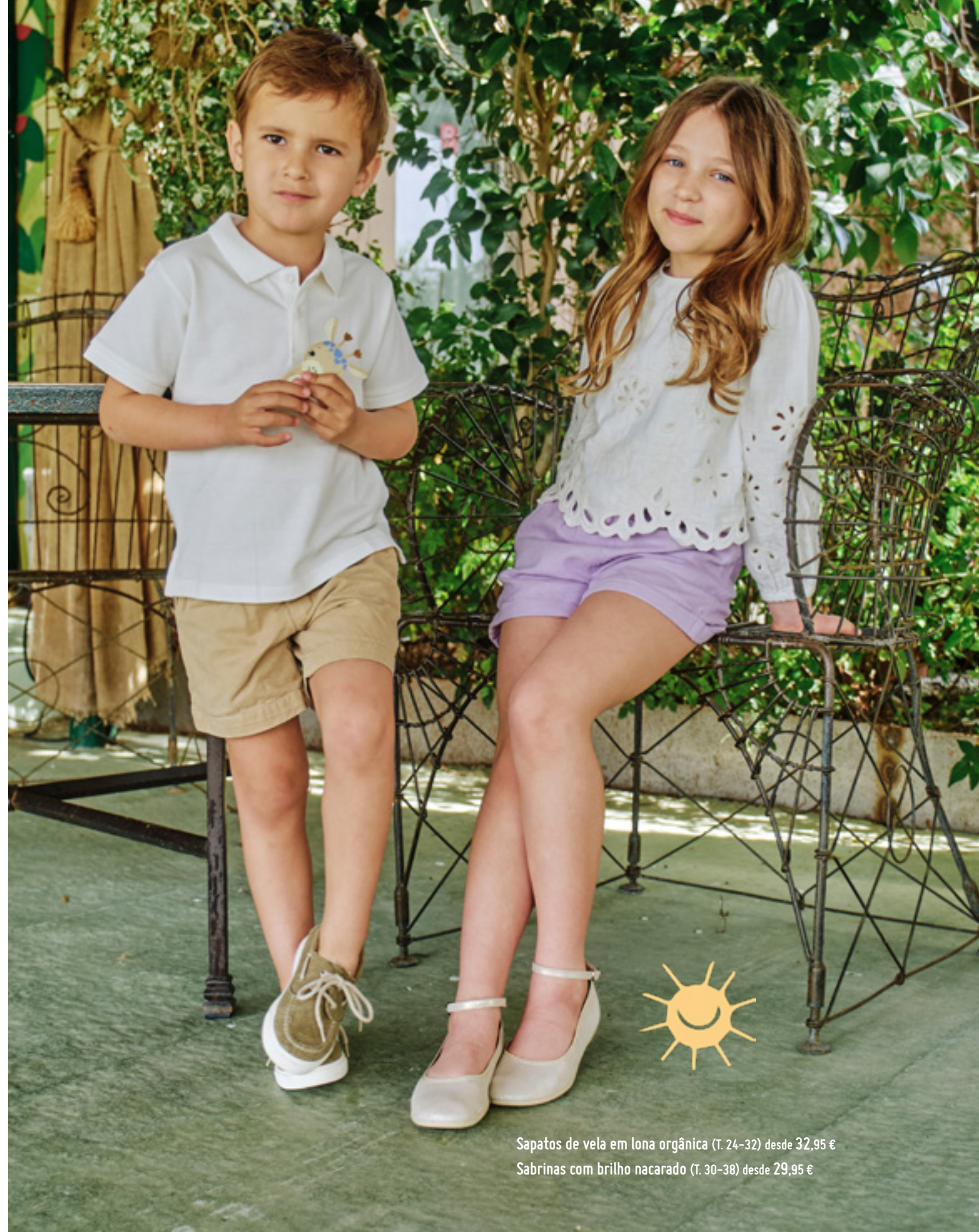
Sapatos de vela em lona orgânica (T. 24-32) desde 32,95 € Sabrinhas com brilho nacarado (T. 30-38) desde 29,95 €