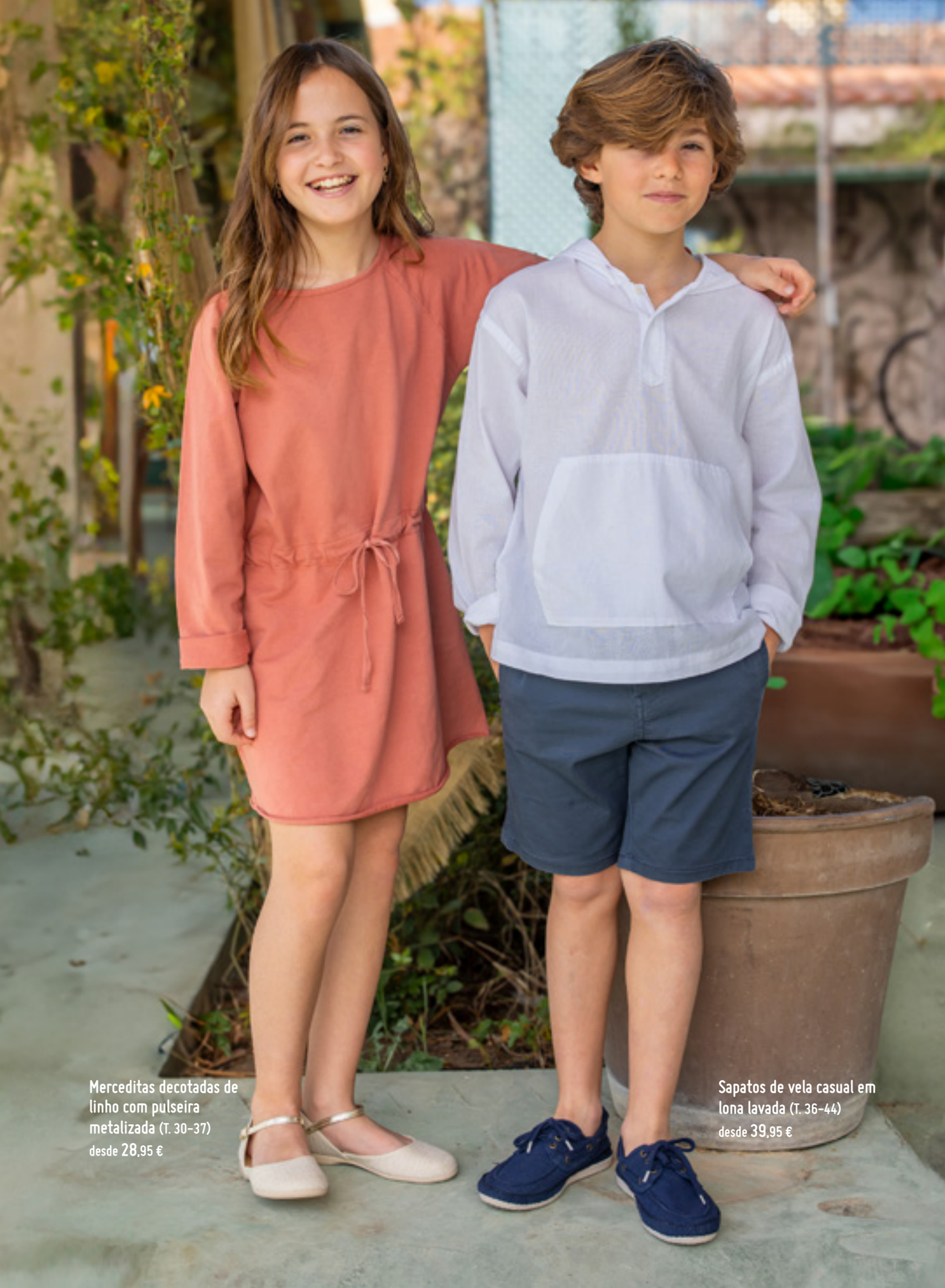
Merceditas decotadas de linho com pulseira metalizada (T. 30-37) desde 28,95 €