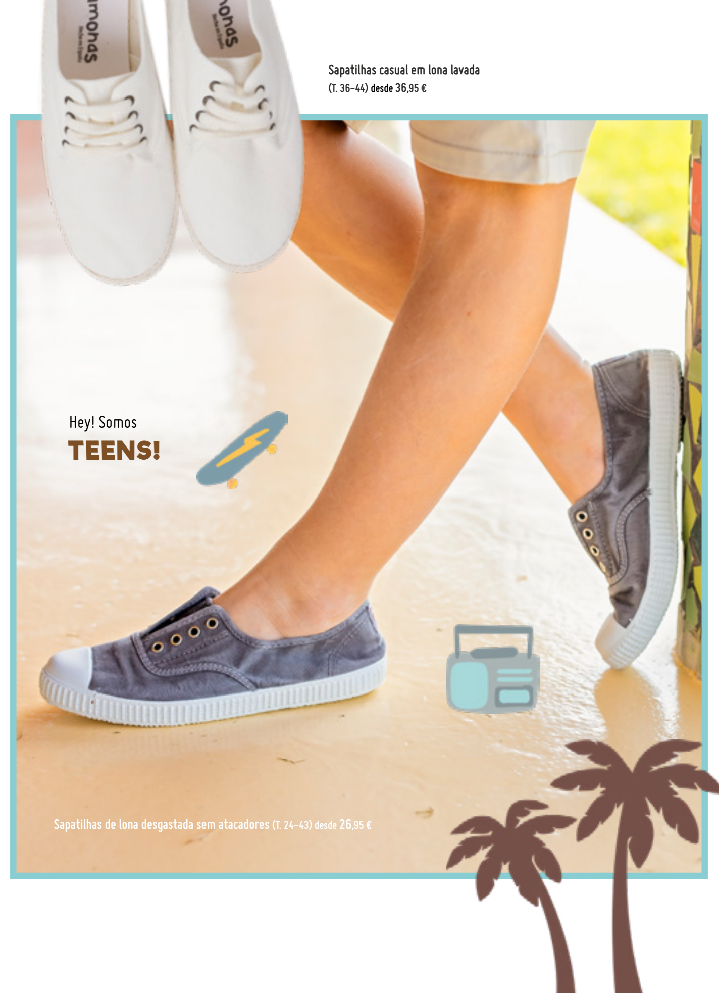
Sapatilhas casual em lona lavada (T. 36-44) desde 36,95 €