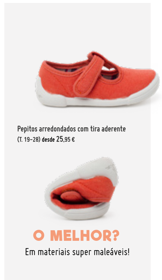
Pepitos arredondados com tira aderente (T. 19-28) desde 25,95 €