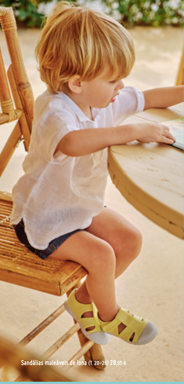
Sandálias maleáveis de lona (T. 20-26) 28,95 €