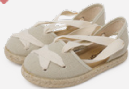
Alpercatas com tiras cruzadas (T. 19-32) desde 29,95 €