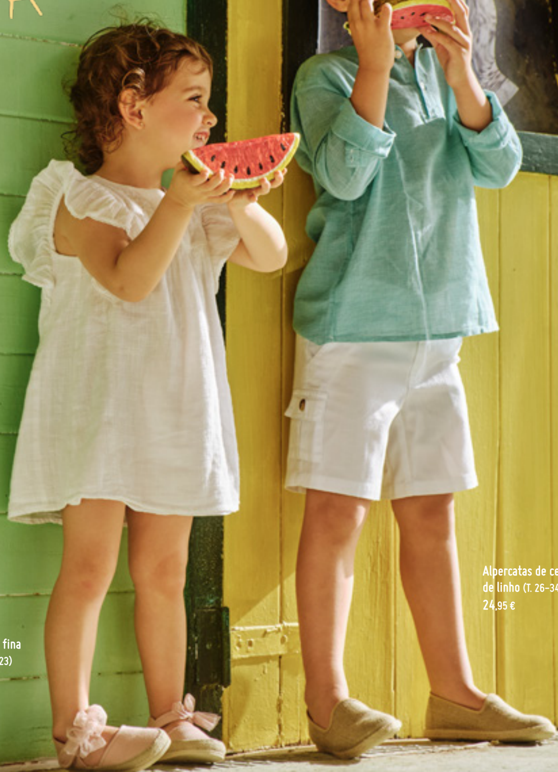
Alpercatas com sola fina e laço de tule (T. 17-23) 31,95 €