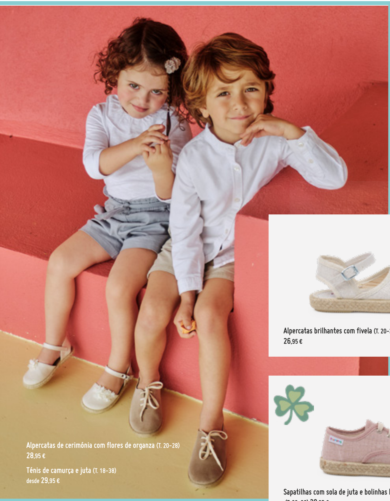
Alpercatas de cerimónia com flores de organza (T. 20-28) 28,95 €