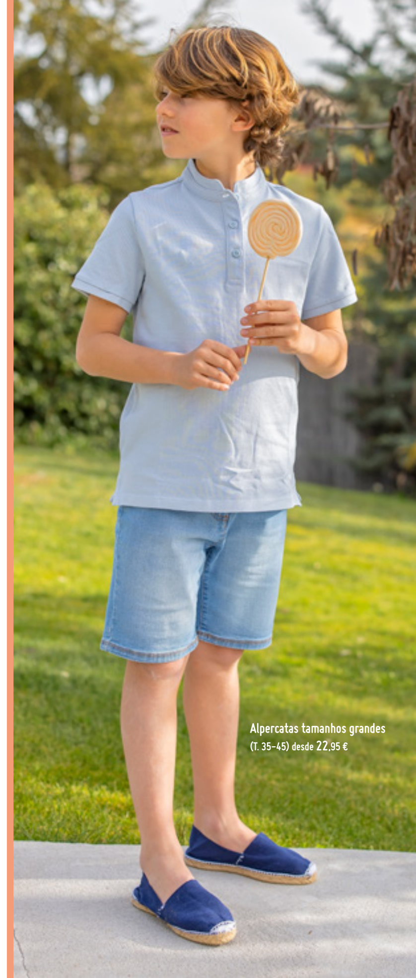
Alpercatas tamanhos grandes (T. 35-45) desde 22,95 €