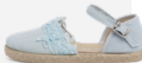
Alpercatas de cerimónia com renda (T. 22-34) desde 34,95 €