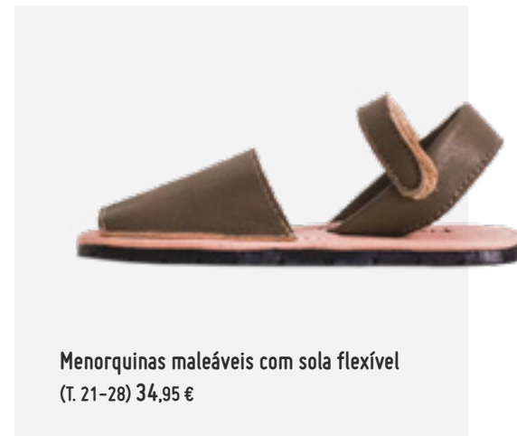
Menorquinas maleáveis com sola flexível (T. 21-28) 34,95 €