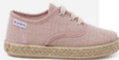
Sapatilhas com sola de juta e bolinhas brilhantes (T. 22-30) 28,95 €