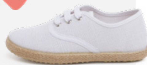
Sapatilhas de linho com sola de alpercata (T. 20-38) desde 26,95 €