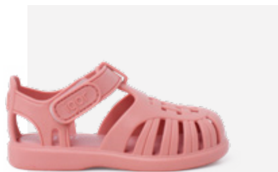
Sandálias de borracha com tira aderente toby (T. 18-29) 23,95 €